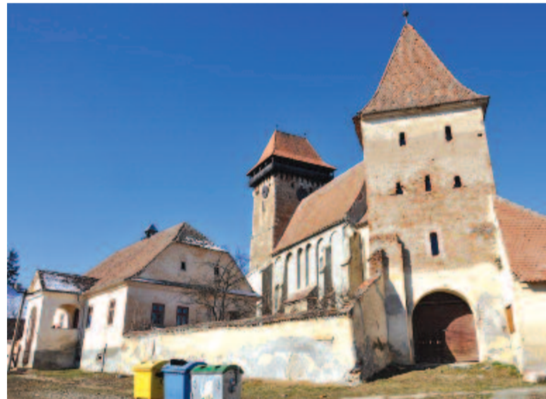
A szászbogácsi evangélikus templom kapubástyája