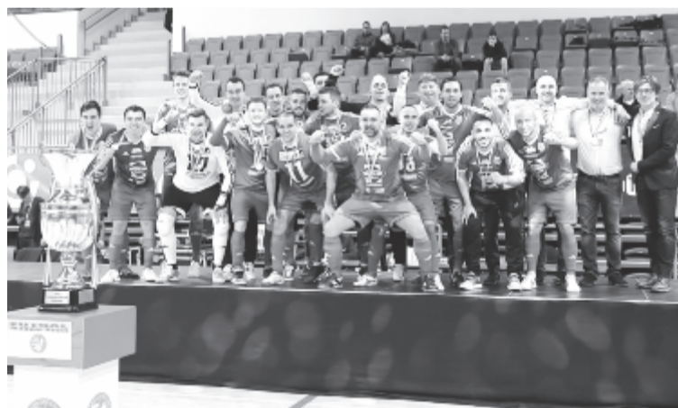
A futsal Magyar Kupa győztese, a Szombathelyi Haladás

* jeddi torna: Red Arrows – Pro Sepsi 10-3, Floorballsuli – Floorbulls 1-11, Black 69 – Red Arrows 5-6, Floorballsuli – Pro Sepsi 4-3, Black 69 – Floorbulls 5-8.