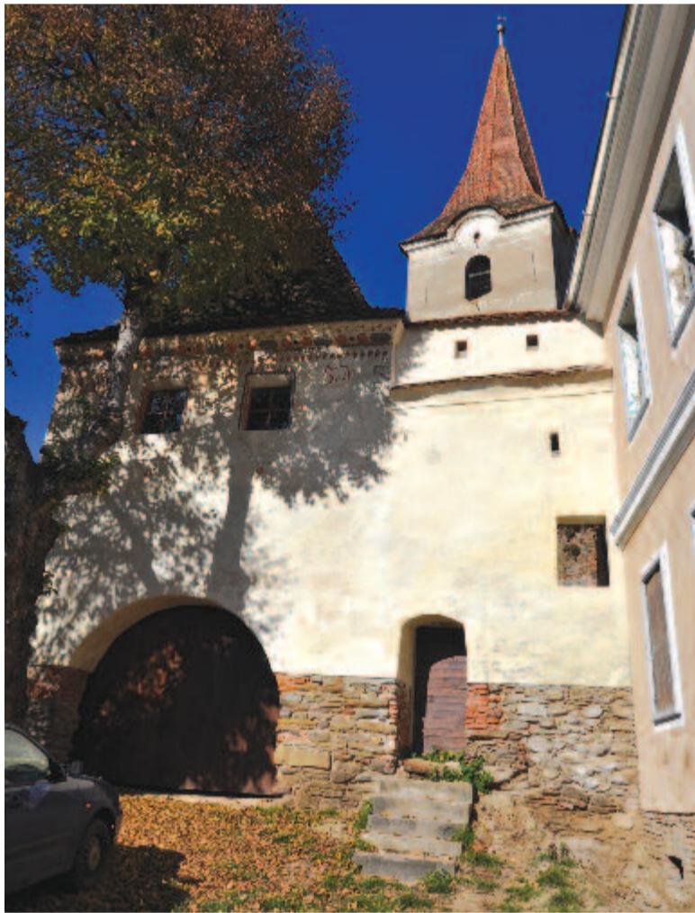
A fületelki erődtemplom bejárata

Az egyhajós templom hosszított, szűk belterű, sima mennyezettel. Az északi falon levő karzaton nyílik a sekrestye bejárata. A karzat tartóoszlopai festettek, szőlőindás, mitikus állatokat és figurákat ábrázoló mintákkal, ez jelzi, hogy falai valamikor teljes egészében ki voltak festve. A reformációt követően takarták le a freskókat, ezek közül csak az északi falon levő töredék maradt meg, amelyen XV. századi