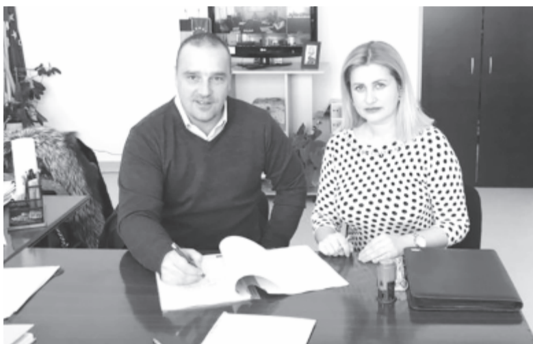
Hétfőn írta alá a szerződést a polgármester Gyulafehérváron

nak, mert ezzel a beruházással megoldódik a kulturális események helyszínének biztosítása. Az előjáró kifejtette: Erdősztgyörgyön számos rendezvény van évente, és azt tervezték, hogy mindezeket a kastély előtti térre költöztetik, mert a helyiek és a turisták számára egyaránt könnyen elérhető. Ha jövőre nem is, de 2020-ban már itt szeretnék ünnepelni a városnapokat is.